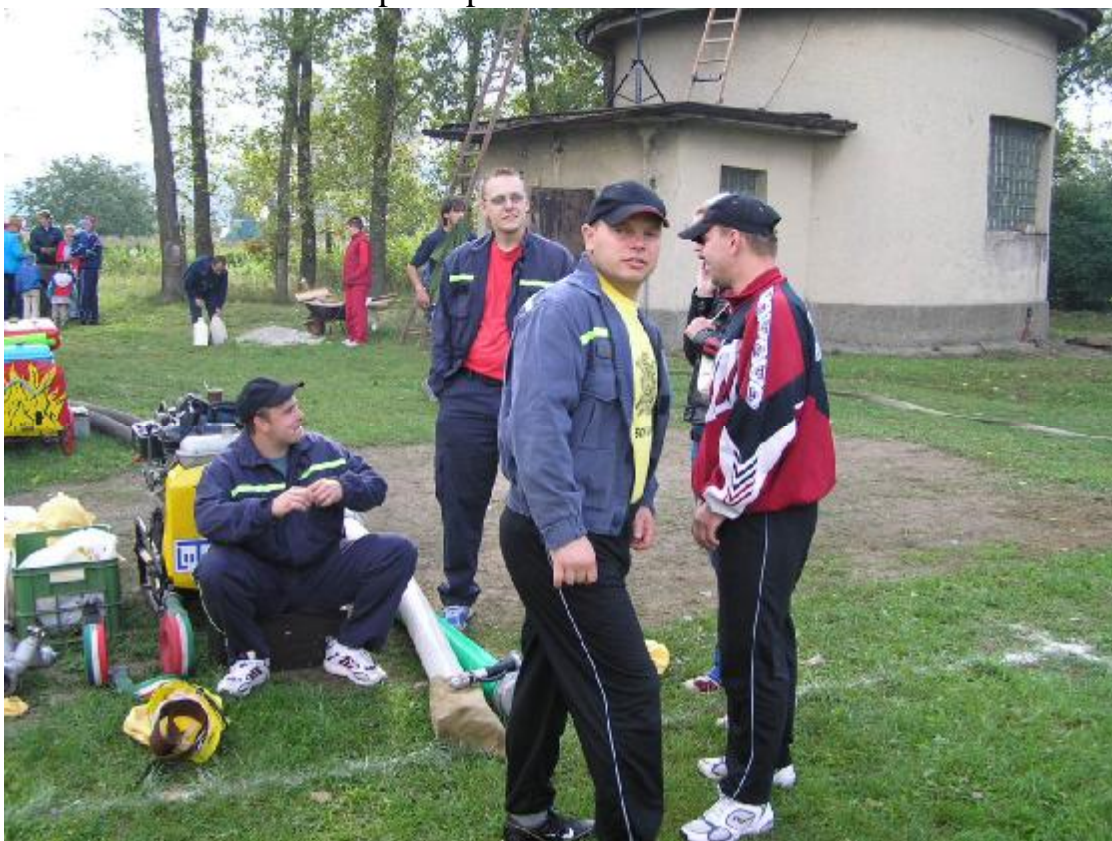
Družstvo Lubence na poháru starosty obce Chyšě

V roce 2006 jsme přidali do sbírky dvě zlatá místa. Jedno na Poháru starosty obce Lubenec, kde jsme porazili družstvo Bošova a druhé při Poháru starosty okresního SDH v Telcích. Pěkná soutěž se konala 26.8.2006 v Chyši. Zde jsme obsadili 4.místo. V královské disciplíně - požárním útoku jsme šlapali na paty vítězi z Bošova. Zaostali jsme pouze 0,43s (Bošov 21,86s, Lubenec 22,29s). Umístění na 4.místě bylo dáno průměrným časem ve štafetě 4x100m (Lubenec 80,05s, Bošov 72,70s). Stejně jako na okresní soutěži rozhodla štafeta. To bude asi hlavní cíl ke zlepšení pro tento rok.