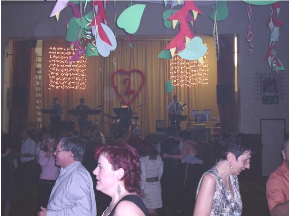
Momentky z II.Hasičského bálu 16.2.2007

(v pořadí II.). V programu nechyběla dámská volenka, taneční vystoupení, bohatá tombola, veselá soutěž. Doufáme, že si každý přišel na své za doprovodu hudební skupiny Dominant.