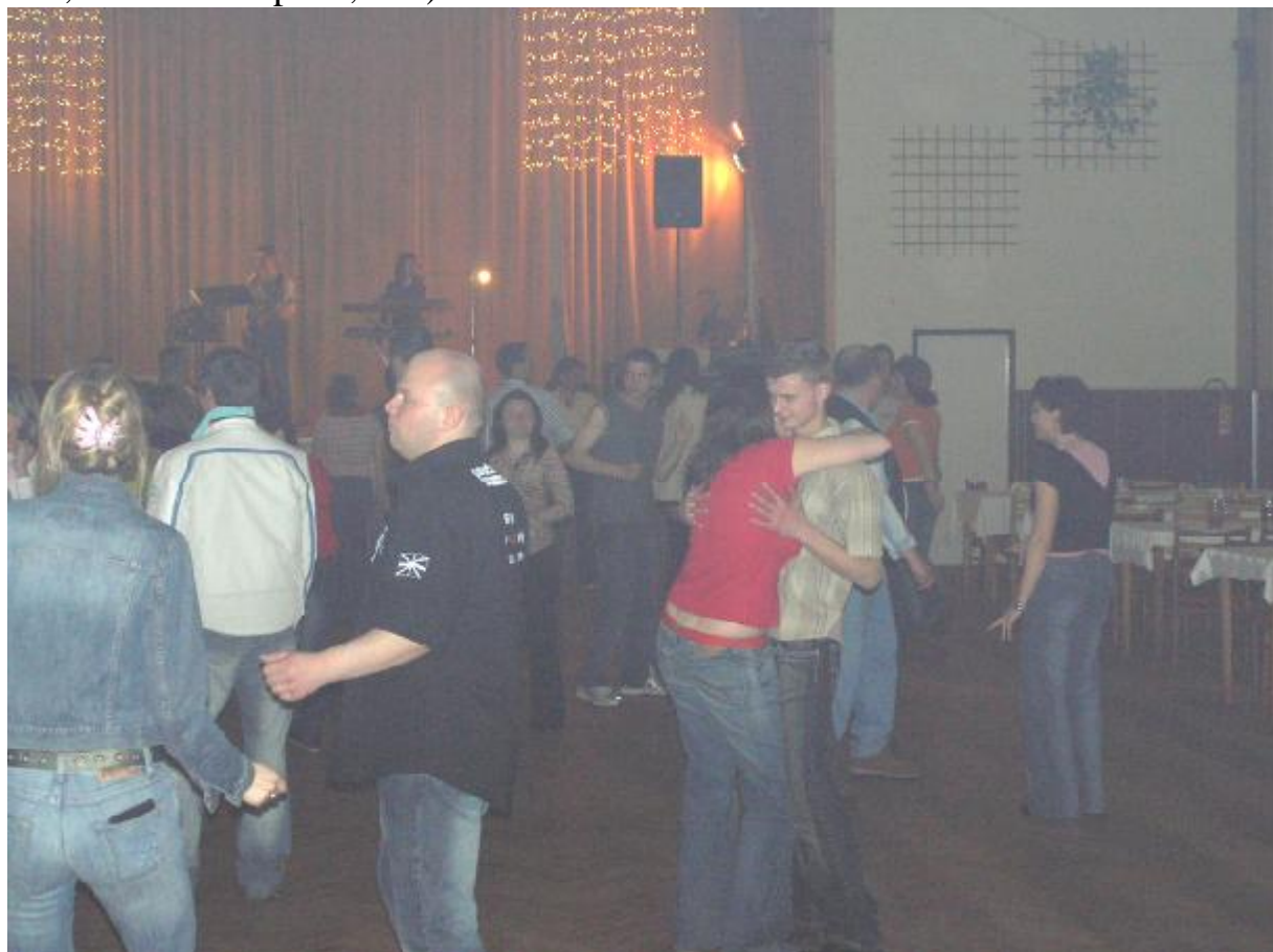
Pohled na taneční parket Velikonoční zábavy 15.4.2006

Hasiči se snaží i o podporu kultury v Lubenci. Příkladem může být již sedmá Velikonoční zábava nebo po páté uspořádaná Václavská zábava tradičně se vstupem pro každého Václava zdarma. Samozřejmě se snažíme vypomoci i s akcemi Obecního úřadu, kde hasiči asistují (pochod okolím Lubence, dětský den, Vavřínecká pouť, atd.)