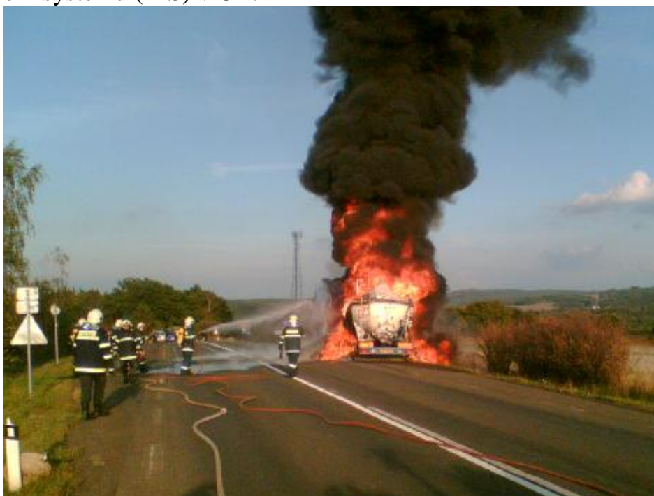
Asistence SDH Lubenec při požáru cisterny na E6

Naše požární stanice patří zařazením do okruhu JPO II v integrovaném záchranném systému (IZS) v ČR.