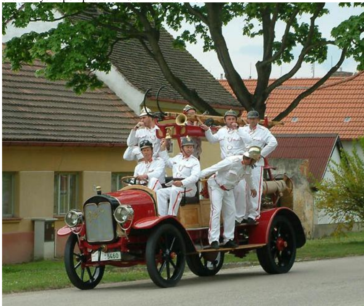
Dobová hasičská technika - Praga R rok výroby 1915

V sobotu 25.května (uváděno i 1.června – pozn.autora) 2007 uplyne 90 let od výbuchu muniční továrny Škodových závodů v Bolevci. 25. května 1917 zahynulo při výbuchu muniční továrny přes 200 pracovníků, 114 bylo nezvěstných a 650 zraněných. Tato katastrofa je označena v historii za tragédii století. V závodě pracovala i značná část zaměstnaných mladistvých - patnácti a šestnáctiletých - většinou žen. I dnes je těžko vylíčit hrůzy paniky, která vznikla po výbuchu. Sdružení boleveckých rodáků s pomocí celé řady autorů ve své publikaci Bolevec a okolí líčí za pomoci očitých svědků průběh celé katastrofy. Svědci, lidé kteří se snažili dostat z rozpoutaného pekla, které výbuchem v oddělení zapalovačů vzniklo, hovoří o panice, šíleném útěku ostatními dráty, sálajícím ohni, svištění strel, padajícími zdi, marném volání o pomoc a marné snaze svých spolupracovníků uniknout smrti.