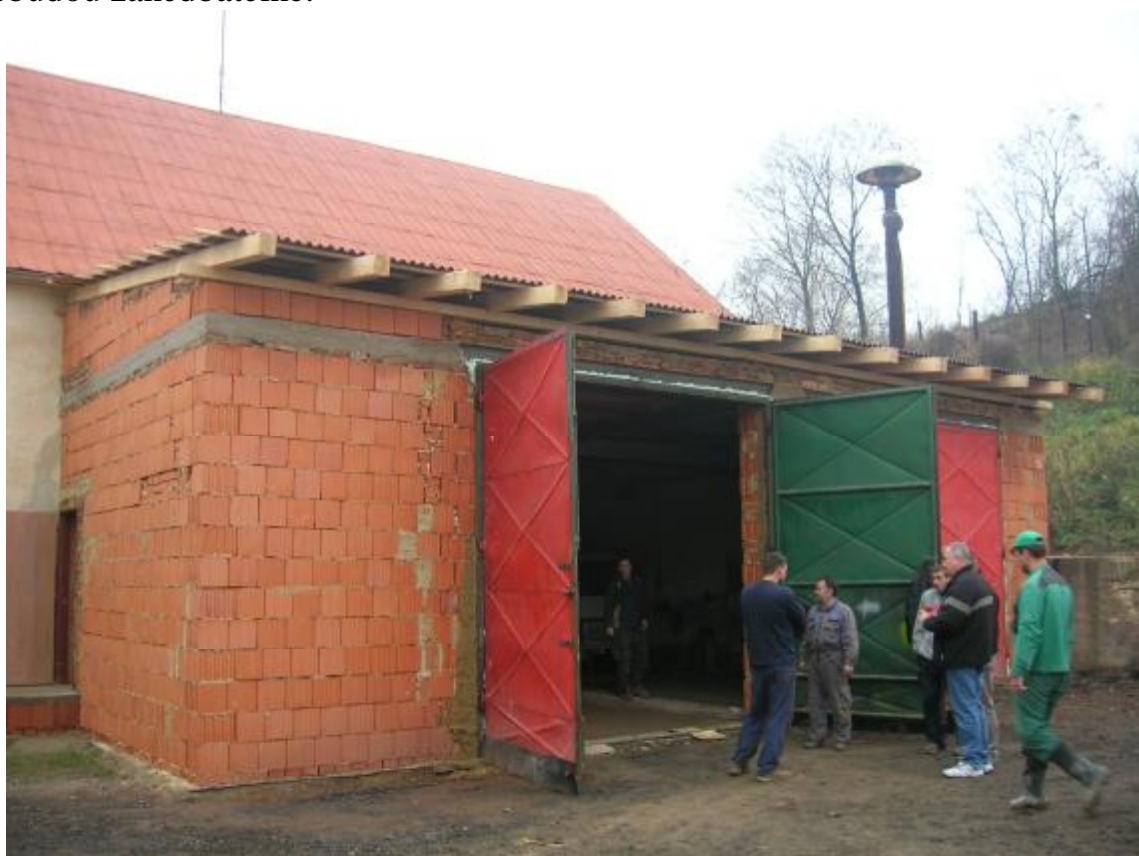
25.11.2006 byla oficiálně ukončena I.etapa přístavby

Jako malý dárek k tomuto výročí může působit započatá přístavba požární zbrojnice dne 1.10.2006. To se povedlo díky zastupitelstvu obce Lubenec, které našlo v rozpočtu prostor pro realizaci této akce. Práce nejsou prováděny pouze dodavatelsky, ale členové SDH se aktivně podílí. Během I.etapy bylo odpracováno členy SDH přibližně 300 brigádnických hodin. V roce 2006 jsme začali I.etapou, která obsahovala rozšíření přízemních garáží a přípravu pro 1.patro. Letos budeme pokračovat II.etapou, kdy by měla být dokončena realizace kompletní „hrubé stavby“. Další postup je závislý na financích, které nebudou zanedbatelné.