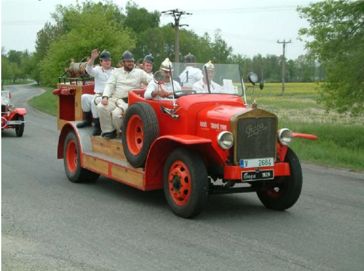
Dobová hasičská technika - Praga L17 (výroba v letech 1912-1931)

Ve městě a okolí ustal veškerý život. Obchody byly zavřeny, přestalo se vyučovat ve školách, v úřadech a továrnách se přestalo pracovat. Obyvatelé okolních obcí a samotné Plzně se utábořili v lesích, polích a lomech, aby se chránili před dalšími výbuchy.