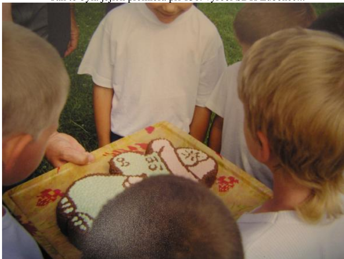
Následovala sladká odměna, kterou během pár let nahradí medaile...