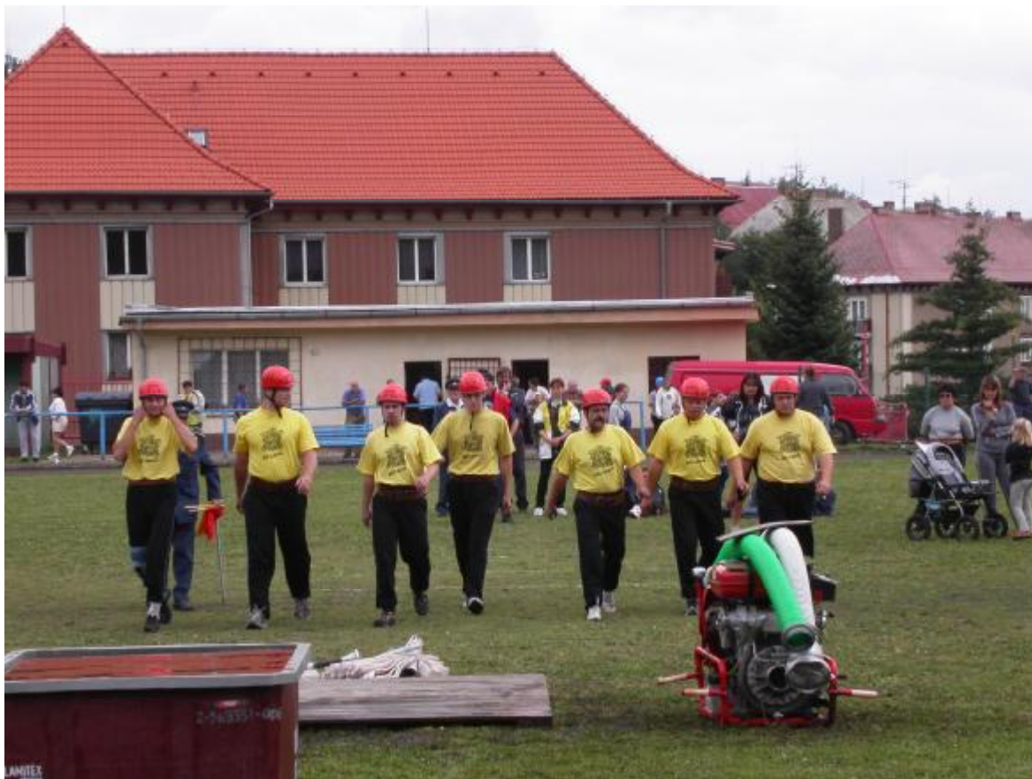
Tak to jsme ještě nevěděli co nás čeká....