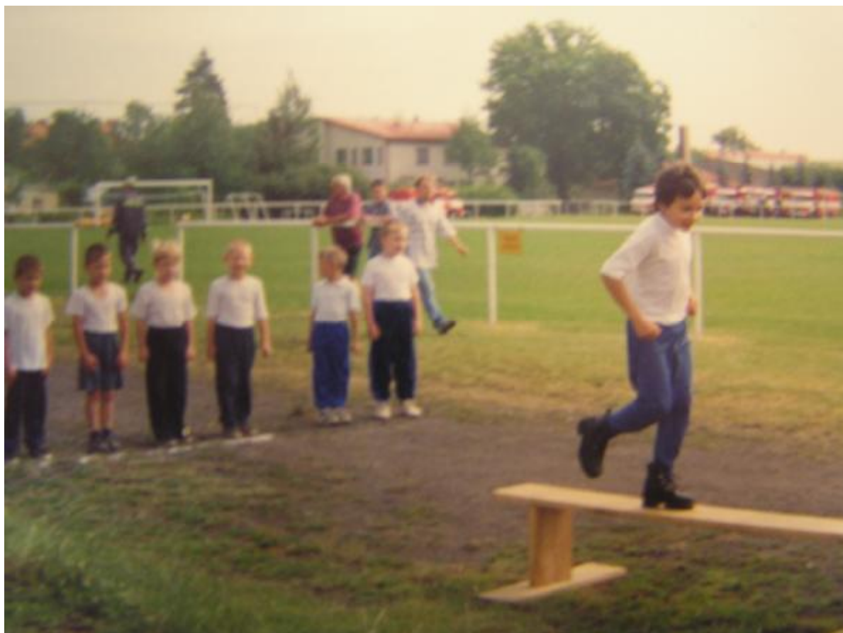
Tak to byla jejich premiéra při 130. výročí SDH Lubenec...