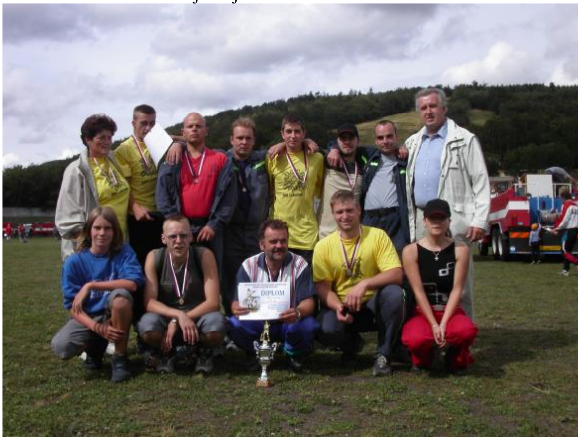
Asi jsme chtěli víc, ale i tak to byl úspěch, kterého si velmi vážíme!!!